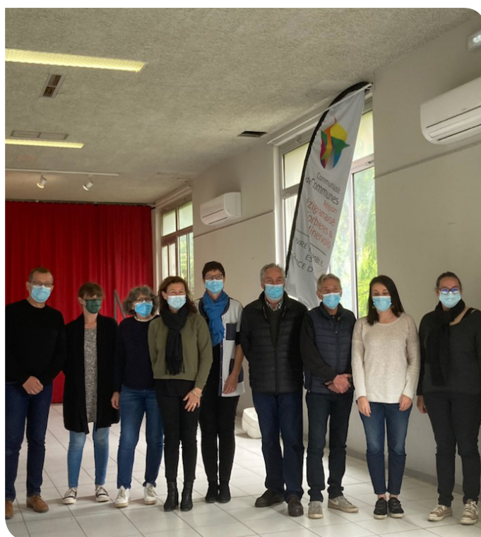
St Laurent de la Cabrerisse le 1er mai