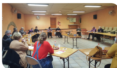
Mairie de Roquecourbe