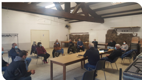
Mairie de Bouisse