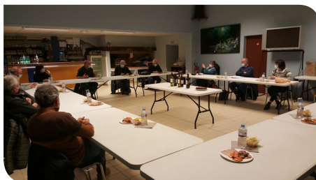
Mairie de Lanet