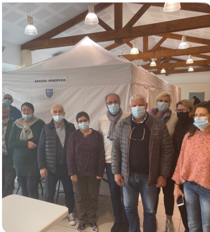
Argens le 17 avril

Les journées vaccination se sont succédées chaque week-end du mois d'avril, et ont été couronnées de succès à chaque fois. Avec un total de près de 1300 personnes vaccinées sur les quatre communes de Mouthoumet le 10 avril, Argens le 17 avril, Canet le 24 avril et St Laurent de la Cabrerisse le 1er mai, ainsi qu'au centre de vaccination de Lézignan-Corbières, la CCRLCM a permis à nombre de nos aînés d'avoir accès à la 1ère injection du vaccin Pfizer.