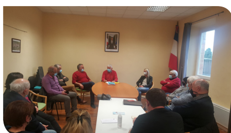
Mairie de Quintillan